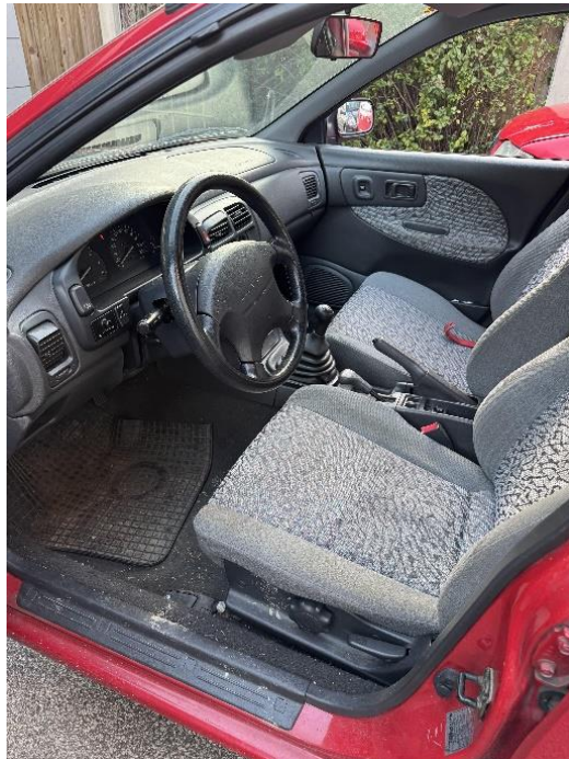
Slika 12: Sprednji notranji del osebnega vozila