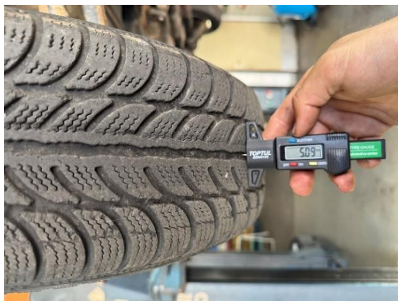
Slika 22: Izgled in globina profila zadnje leve pnevmatike