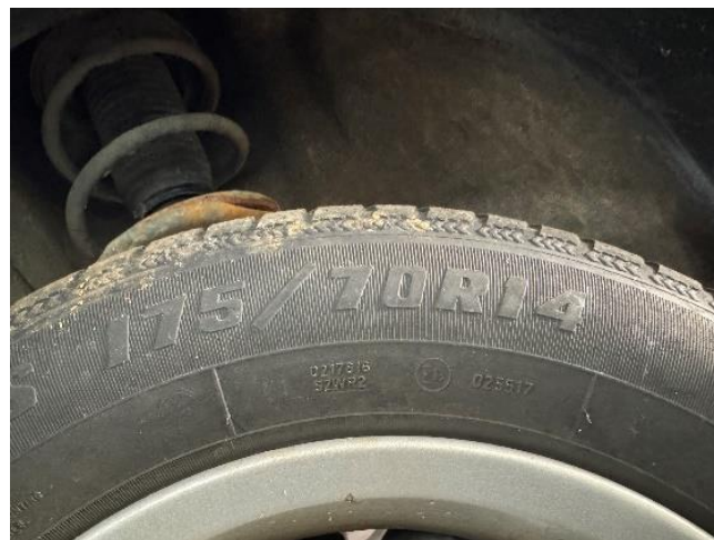
Slika 19: Dimenzije pnevmatike

Ob pregledu pnevmatik sem ugotovil, da ima osebno vozilo Subaru Impreza nameščene pnevmatike znamke Sava, tip Eskimo S3, in sicer z dimenzijami 175/70/14R (Slika 19). Gre za pnevmatike z oznako M+S, torej primerne za blato in sneg. Zaradi starosti pnevmatik sem se odločil, da jih bom zamenjal.