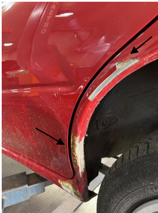
Slika 17: Poškodba leve stranice in zadnjih levih vrat