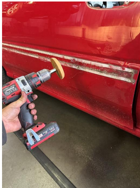
Slika 29: Radiranje lepila z vrat