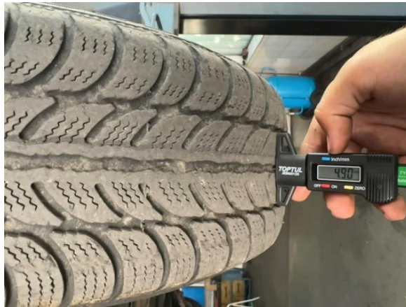
Slika 23: Izgled in globina profila zadnje desne pnevmatike