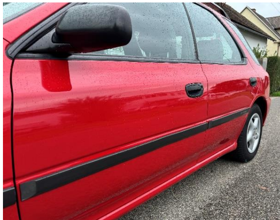
Slika 46: Popravljeno in pobarvano osebno vozilo spredaj levo