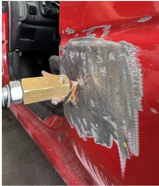
Slika 32: Uporaba točkovnega varilca