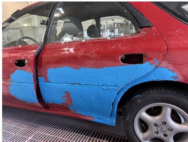
Slika 36: Drugi nanos karoserijskega kita