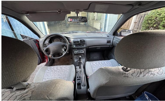
Slika 11: Sprednji notranji del osebnega vozila