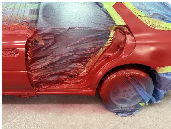
Slika 42: Pobarvan zadnji levi bok osebnega vozila