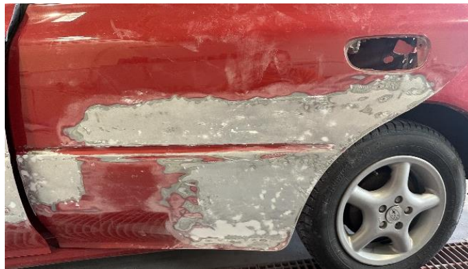
Slika 35: Pobrušen prvi nanos karoserijskega kita