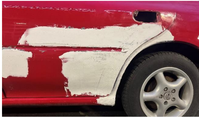
Slika 34: Prvi nanos karoserijskega kita