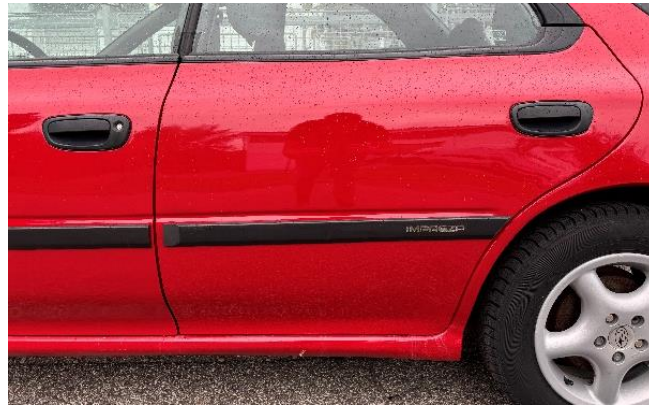
Slika 45: Popravljeno in pobarvano osebno vozilo zadaj levo