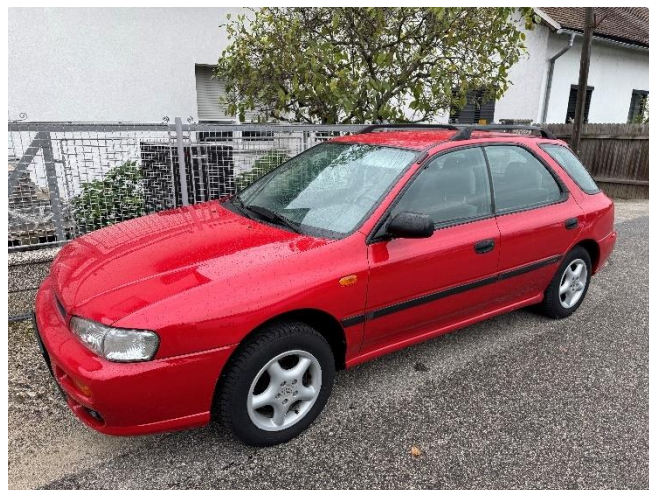
Slika 47: Končni izgled popravljenega osebnega vozila