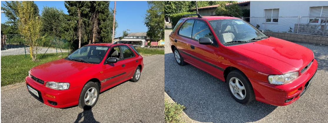
Slika 8: Pogled na osebno vozilo spredaj levo in spredaj desno