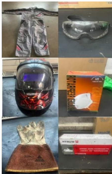
Slika 5: Osebna varovalna oprema

Uporaba OVO je ključna za zmanjšanje tveganja poškodb in zaščito zdravja delavcev (GOV, 2025). OVO (Slika 5) je pomemben pri delih v avtomehanični dejavnosti, tudi pri kleparskem in ličarskem delu, kjer je pomembno, da se OVO uporablja, prav tako pa je pomembno, da se uporablja pravilno in da je ta oprema v dobrem stanju, torej da ni dotrajana ali poškodovana, kar bi seveda vplivalo na varnost.