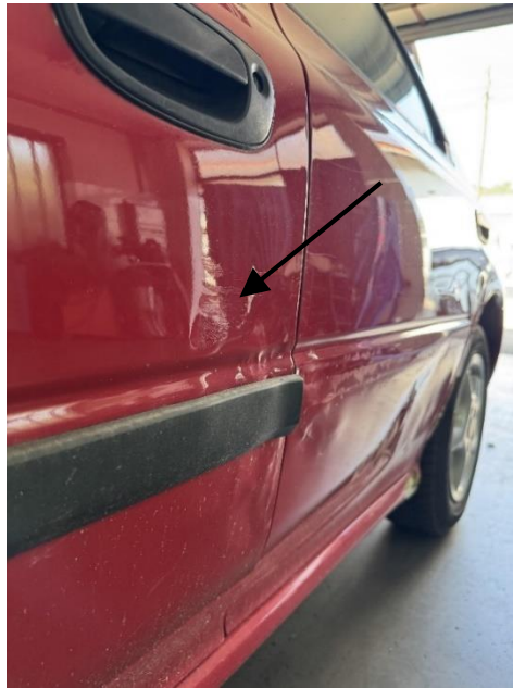
Slika 14: Poškodba sprednjih levih vrat