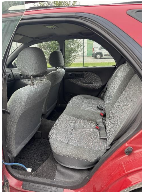
Slika 13: Zadnji notranji del osebnega vozila