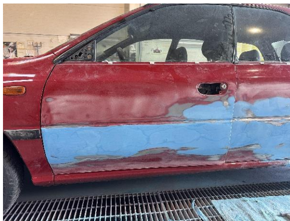
Slika 37: Pobrušen drugi nanos karoserijskega kita