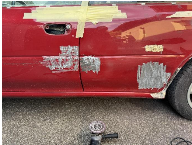
Slika 30: Brušenje barve s pločevine