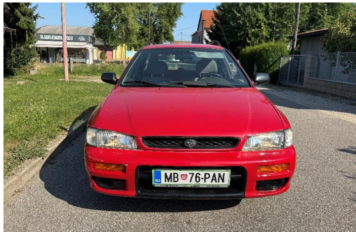
Slika 7: Pogled na osebno vozilo spredaj