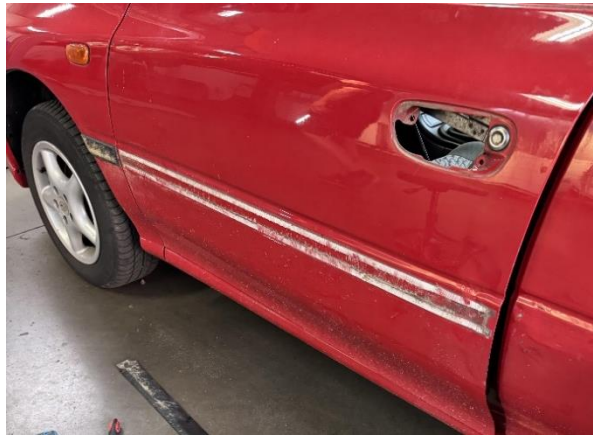
Slika 28: Demontaža zunanjih okrasnih letvic