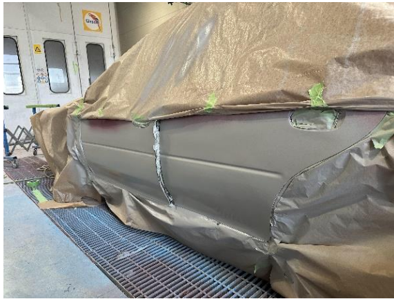
Slika 38: Nanos temeljnega premaza