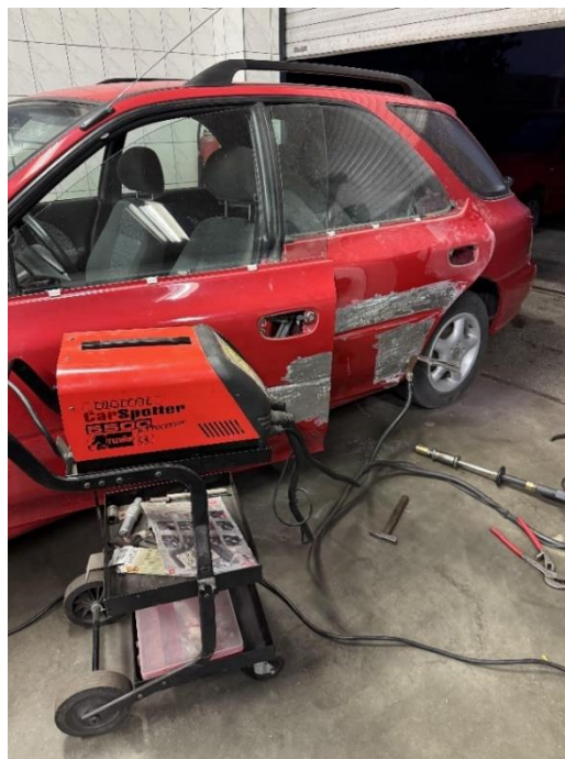
Slika 31: Točkovni varilec

Sledilo je ravnanje pločevine s kladivom ter kleparskimi podstavki. Kar ni bilo mogoče izravnati na ta način, sem ravnal s pomočjo točkovnega varilca (Slika 31), s katerim sem lahko natančno popravljaj poškodovane dele vozila (Slika 22). Pri uporabi točkovnega varilca so nastale manjše izbokline, ki jih je bilo potrebno pobrusiti z brusilko in brusilno ploščo.