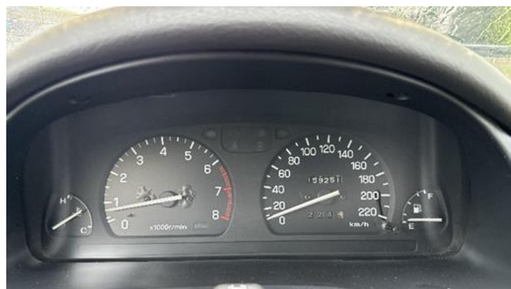
Slika 6: Trenutno stanje števca kilometrov