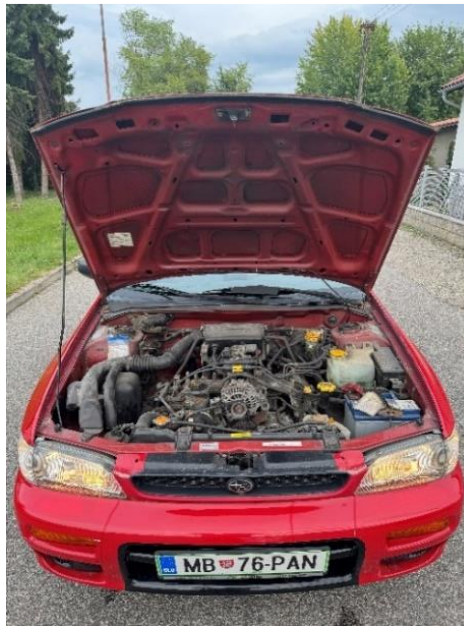
Slika 24: Pregled motorja osebnega vozila