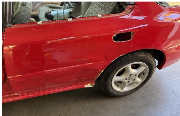
Slika 27: Demontaža okrasnih letvic na osebnem vozilu