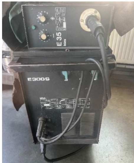
Slika 3: Varilni aparat