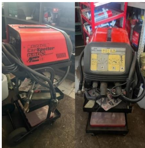
Slika 4: Točkovni varilnik