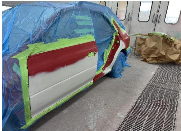
Slika 39: Posušen temeljni premaz