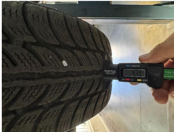
Slika 20: Izgled in globina profila sprednje leve pnevmatike