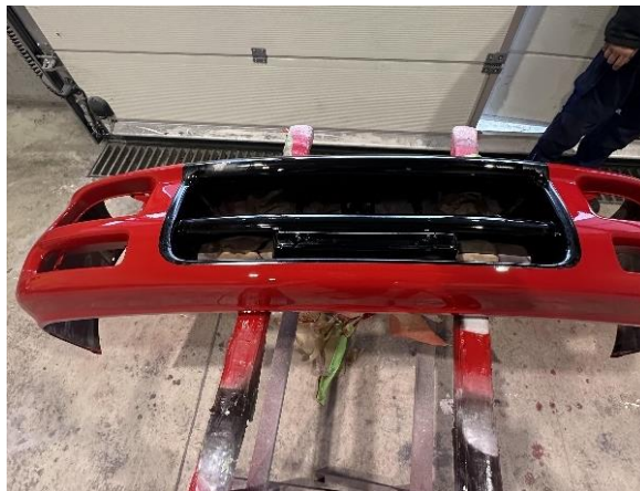
Slika 44: Pobarvana sprednja obloga odbijača

Zaradi poškodbe na sprednjem desnem delu osebnega vozila je bila pobarvana in s tem popravljena tudi sprednja obloga odbijača (Slika 44).