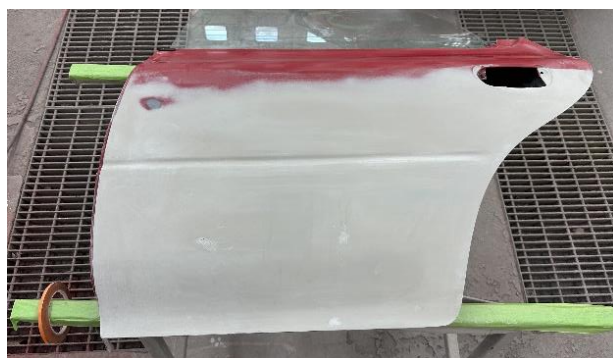
Slika 40: Odmontirana zadnja leva vrata

Zadnja leva vrata sem zaradi lažjega barvanja leve stranice odmontiral z vozila (Slika 40), s čimer sem omogočil lažje kasnejše barvanje celotne površine zadnjega levega boka.