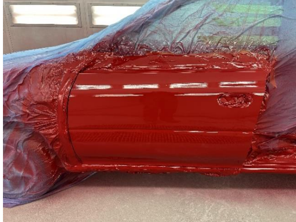
Slika 41: Pobarvana sprednja leva vrata osebnega vozila

Sledilo je barvanje osebnega vozila (Slike 41, 42 in 43). Vozilo je bilo barvano z akrilno barvo, ki je bila določena s pomočjo številke šasije, sama niansa barve pa tudi s pomočjo barve osebnega vozila.