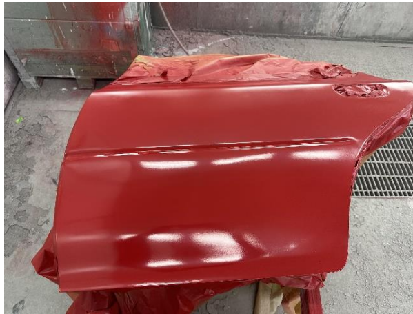
Slika 43: Pobarvana zadnja leva vrata osebnega vozila