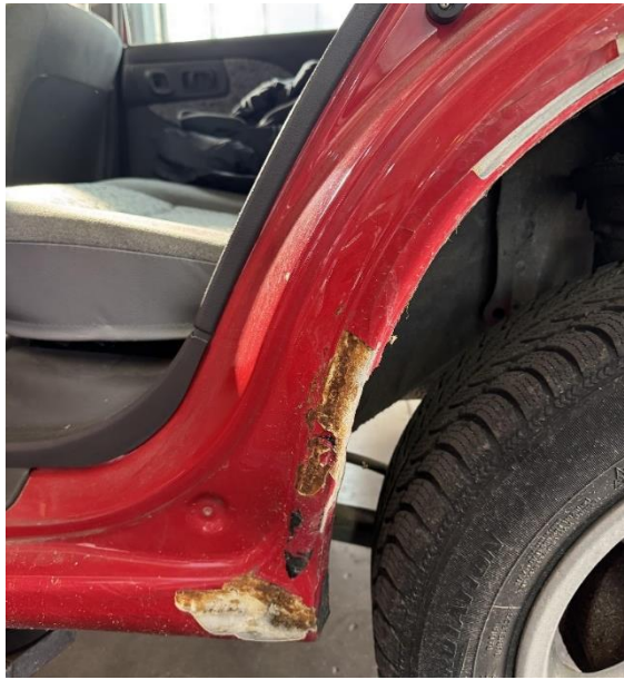
Slika 16: Poškodba leve stranice