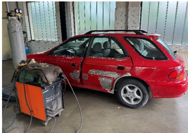
Slika 33: Varilni aparat

Za izravnavo dela leve stranice sem uporabil tudi varilni aparat (Slika 33), saj popravilo na tem mestu ni bilo mogoče, zato sem moral pločevino zadnjega blatnika zamenjati.