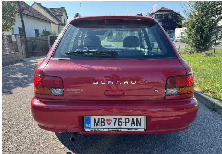
Slika 9: Pogled na osebno vozilo zadaj