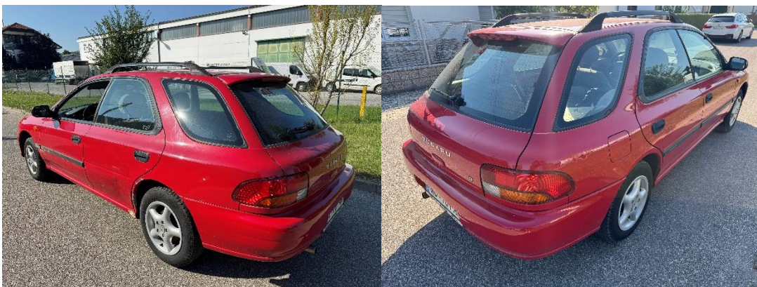
Slika 10: Pogled na osebno vozilo zadaj levo in zadaj desno