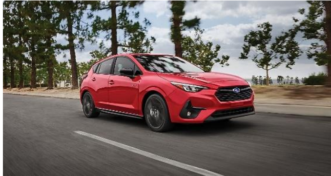
Slika 1: Najnovejši Subaru Impreza, letnik 2025