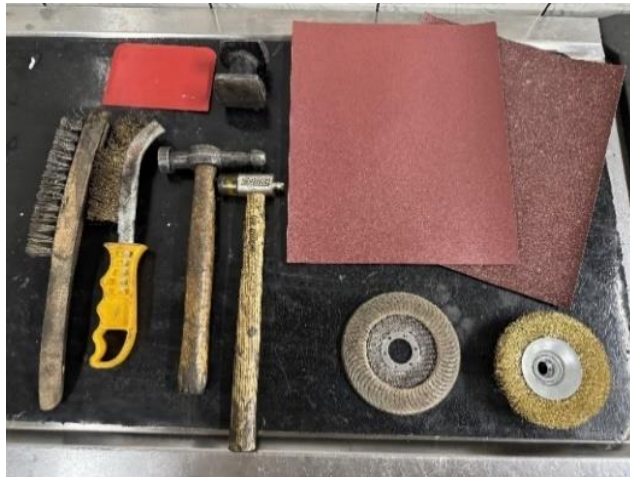
Slika 2: Ročna kleparska orodja