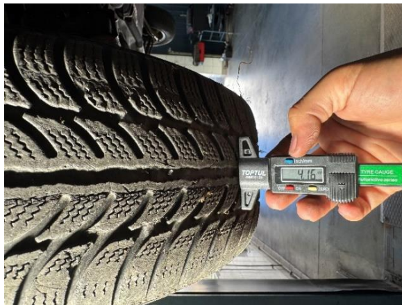
Slika 21: Izgled in globina profila sprednje desne pnevmatike