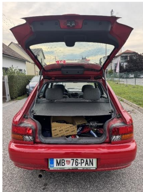
Slika 25: Prtljažna vrata osebnega vozila

Prepričal sem se tudi o funkcionalnosti prtljažnih vrat (Slika 25). Vrata se pravilno odpirajo in zapirajo ter ob odprtju ostanejo v dvignjenem položaju, kar potrjuje ustrezno delovanje mehanizma.