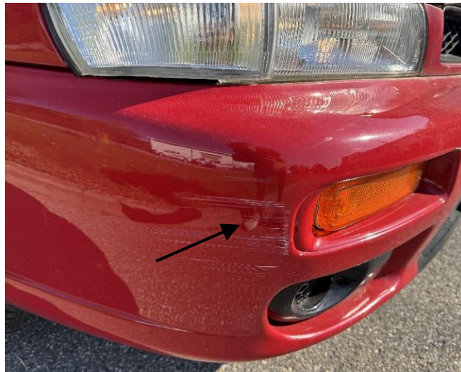
Slika 18: Poškodba sprednje obloge odbijača